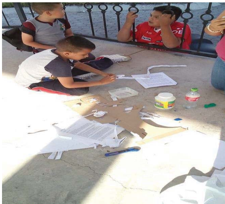
Imagen 1 el taller de cartonería

Primero se les enseñó a cortar las hojas con el cúter, con el fin de que quedaran lisas y de el mismo tamaño, después de esto se le agregó pegamento especial para encuadernación en el lomo de las hojas, esto para crear un solo conjunto. Para terminar, se realizó la pasta con cartón y adornado con papel de regalo.