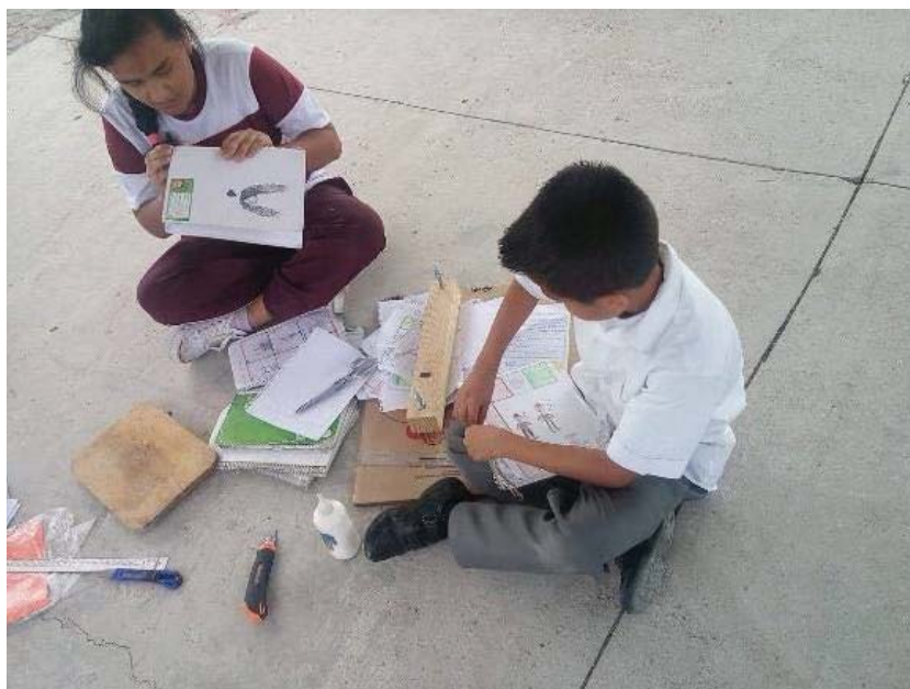
Imagen 2 encuadernación de libretas. Intervención

Como parte del taller a los alumnos se les incito y apoyo a realizar una limpieza dentro de la comunidad, en esta se buscaba contribuir a la limpieza de la comunidad, con la ayuda de los asistentes en el curso. Ellos recolectaran basura en las principales calles del barrio de La Yerbabuena y el rio que la atraviesa. La actividad solo se pudo llevar a cabo en algunas calles, por la poca respuesta presentada y la decisión de los padres de no permitir que sus hijos entraran en el rio.