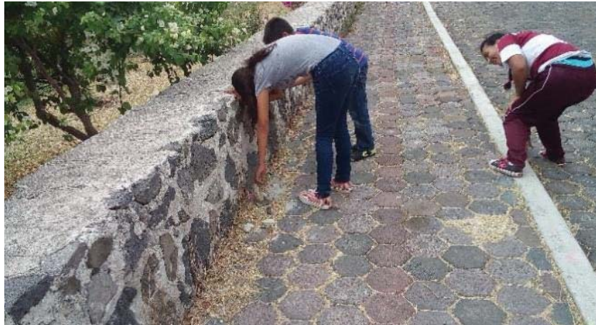
Imagen 3 recolección de residuos

En esta parte de la intervención, los participantes se sintieron muy emocionados con la actividad final, esto por volver con las actividades manuales en donde podían utilizar su creatividad, con esto se les otorgó la libertad de tomar algo y de agregarle o modificarle a su manera lo que ellos creyeran más conveniente, al darles esta oportunidad, se presentó la gran felicidad dentro de ellos. Cabe mencionar que dentro de esta actividad de cierre se unieron niños y jóvenes que pasaban por la zona, pero solo agregaban algo y se retiraban.