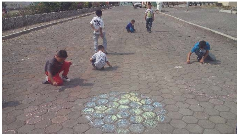
Imagen 4 mural

En esta parte de la intervención, los participantes se sintieron muy emocionados con la actividad final, esto por volver con las actividades manuales en donde podían utilizar su creatividad, con esto se les otorgó la libertad de tomar algo y de agregarle o modificarle a su manera lo que ellos creyeran más conveniente, al darles esta oportunidad, se presentó la gran felicidad dentro de ellos. Cabe mencionar que dentro de esta actividad de cierre se unieron niños y jóvenes que pasaban por la zona, pero solo agregaban algo y se retiraban.