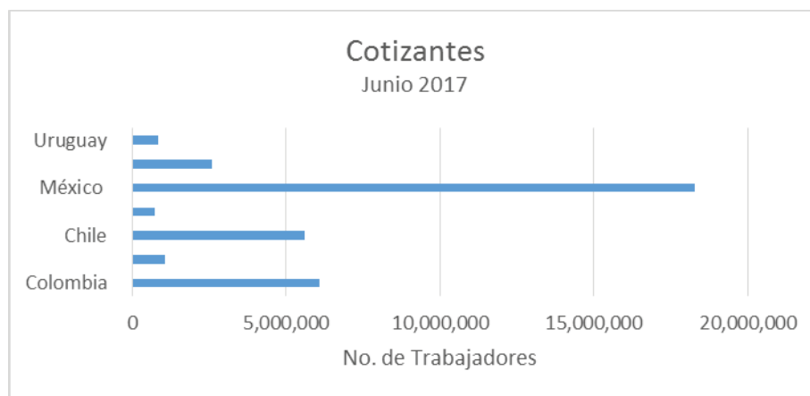
Gráfico 1. Cotizantes a los Fondos de Pensiones de capitalización individual en países seleccionados de América Latina