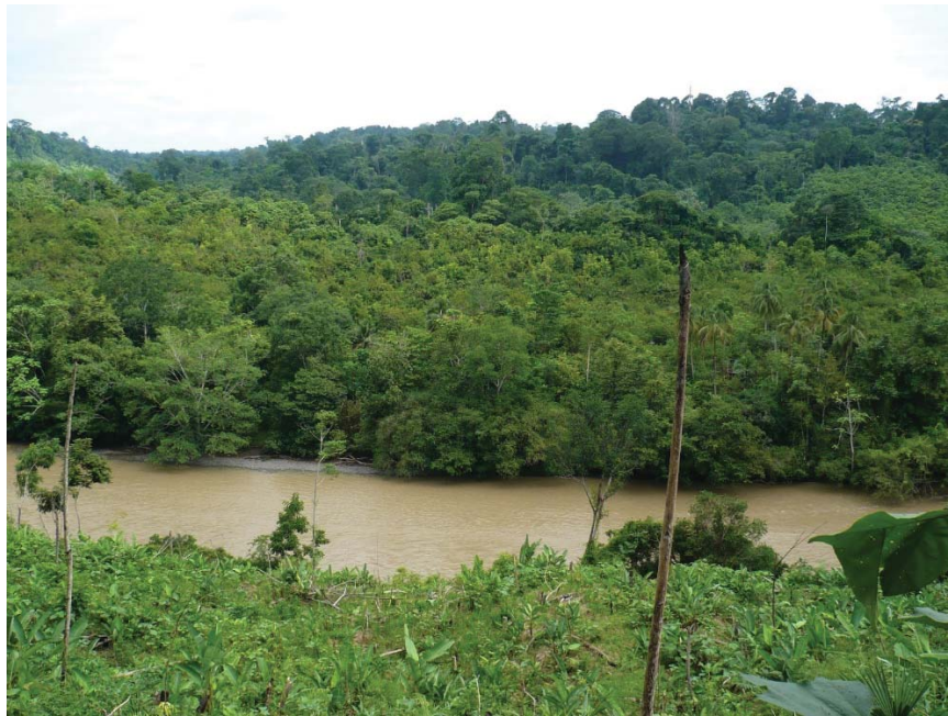
Fotografía 2: Río Sinú