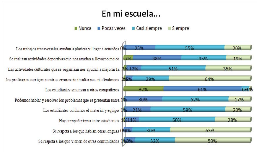
Gráfica 1 Porcentaje de frecuencia de respuestas de convivencia escolar en el nivel bachillerato.

En el ámbito escolar se pueden encontrar diversas agresiones físicas a la comunidad estudiantil y educadores que varían en intensidad y frecuencia. Estas agresiones van desde robos, deterioro intencionado de material, insultos, burlas, y amenazas. Éstas serían algunas manifestaciones de la violencia física o psicológica que más se repite en los centros escolares, y que se van naturalizando y se reproducen en la cotidianidad de la vida escolar. Es por ello que en el primer apartado de la encuesta se indaga en conocer de forma general como se manifiesta la convivencia en su escuela. Consta de diez reactivos y los resultados se presentan en Grafica 1.