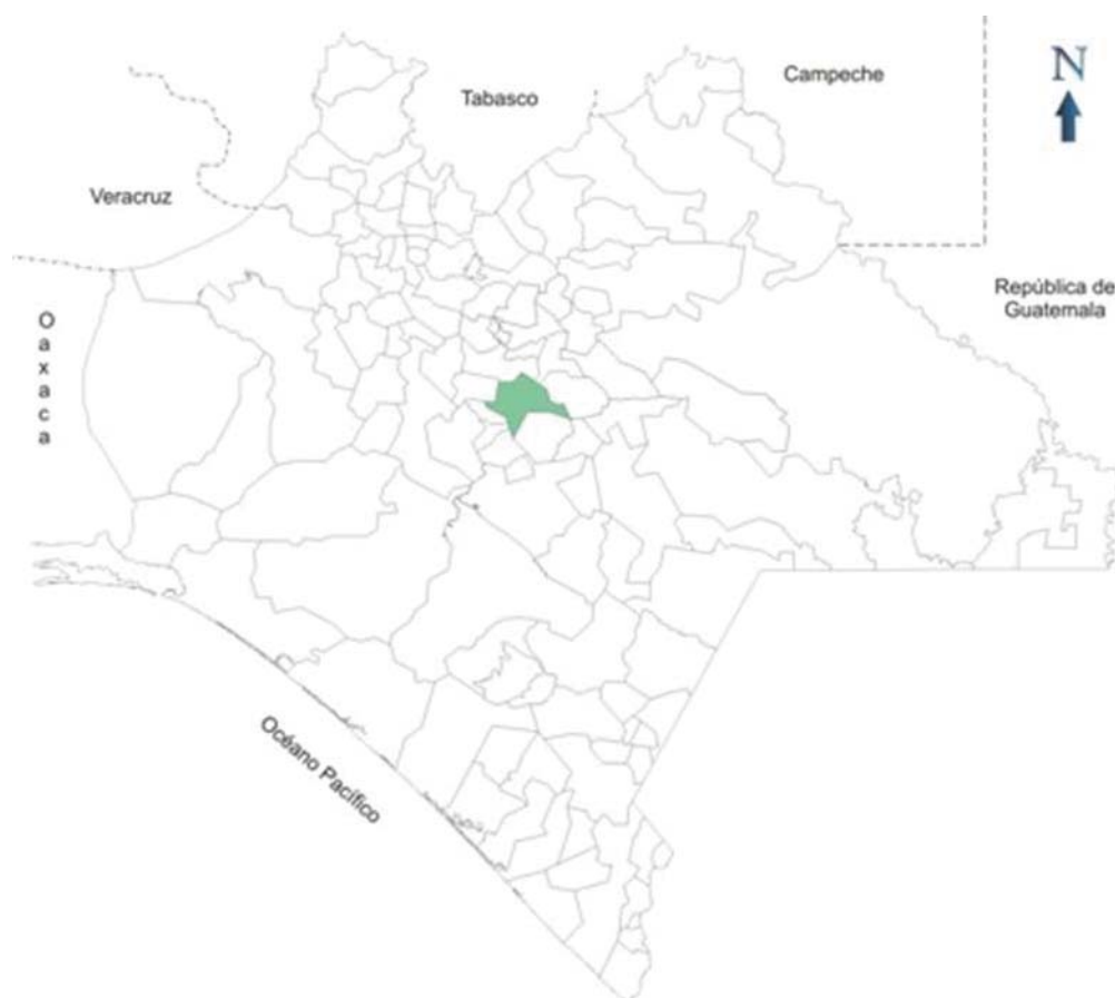
Mapa 1: el municipio de San Cristóbal de Las Casas