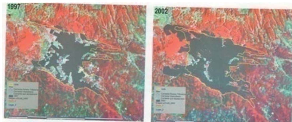
Mapa 4: La mancha urbana en SCLC (mapa satelital 2)