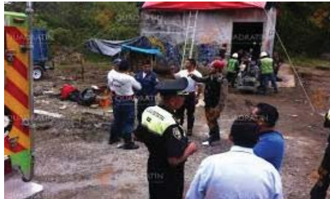
Fotografía afuera del respiradero Cutzamala