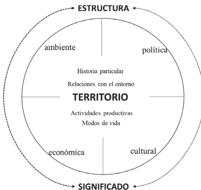
Esquema 2. El territorio: relaciones estructura / significado