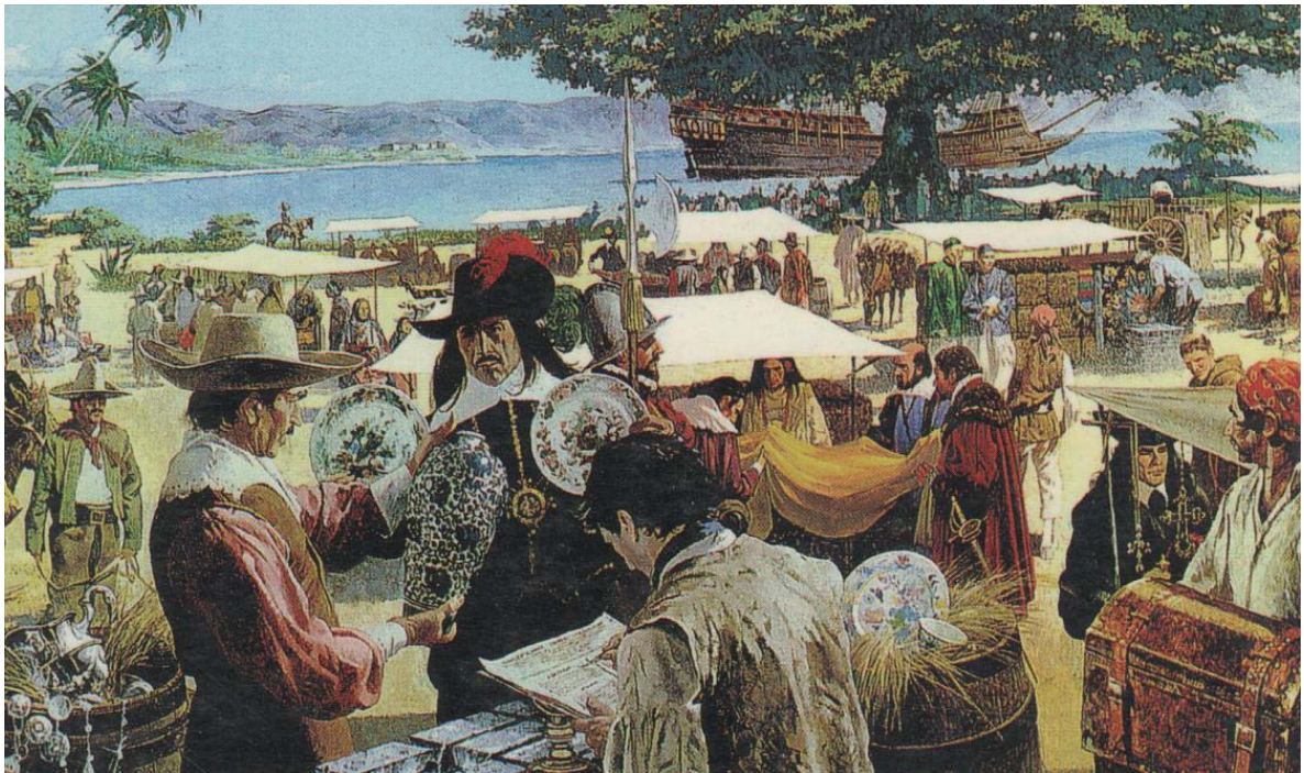
Cuadro de Robert Mc. Innis. Representación de la llegada de la nao.

Cuando los barcos llegaban a Acapulco, éste se poblaba con una amplia gama de personajes, comerciantes que llegaban para hacer negocios, misioneros y soldados forzados que eran transportados a Filipinas, mujeres que vendían comida, marineros que descendían de los barcos, arrieros que llegaban de diversos lugares a comprar los artículos que llegaban en los galeones. La aduana, el hospital y las casas mismas se llenaban de habitantes temporarios con sus costumbres diversas, sus múltiples divertimentos y sus distintos atuendos. Se contaba además con una población lugareña de diversos orígenes y jerarquías sociales. Pero sobre todo es importante recalcar que el estudio de la vida cotidiana nos muestra a las mujeres, cuya historia no era visible