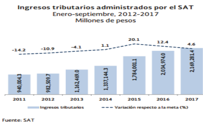
Ilustración No.1 Ingresos tributarios administrados por el SAT

En el caso del Impuesto Especial Sobre Producción y Servicios, la información reporta que en varios años hubo cifras negativas reflejadas por los rezagos de pago de las empresas de PEMEX que no estaban declarando ni pagando y como efecto de la reforma del 2014 regularizaron paulatinamente su situación llevan entonces a un incremento sustancial en la recaudación de dicho impuesto. Puede inferirse que se ser un impuesto del que escasamente se recaudaba pasó a ser con la política fiscal aplicada, un impuesto que ahora es significativo.