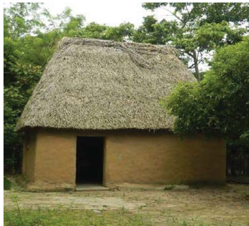
Imagen 1 Casa de palma y barro

En la imagen 1 podemos ver una casa con techo de palma y paredes de barro, conservando un clima fresco en las temporadas calurosas, construida en la comunidad con el proceso anteriormente descrito: