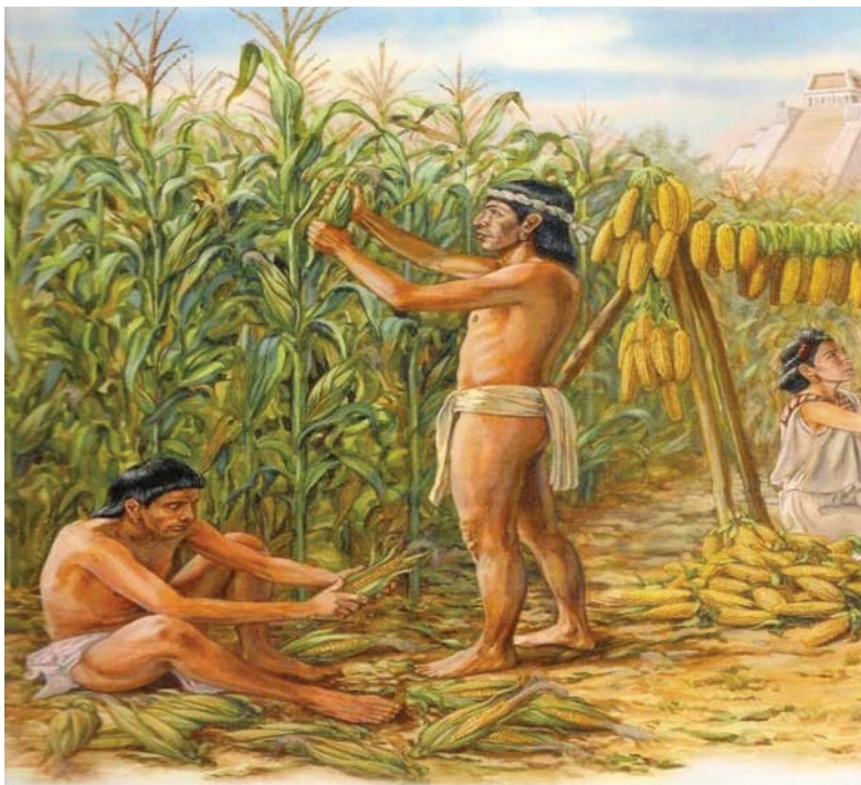
Imagen 3 Representación de la Pixka (cosecha)

Ayudar en el proceso de la cosecha se convertía en un ciclo, ya que desde la cosmovisión del pueblo esta contribución era retribuida de la misma manera, ayudando a la persona quien te ayudaba. En la cosecha del maíz las personas buscaban su Uchuh (ochole) para su siguiente siembra, pero la parte simbólica de la tradición empezaba una vez terminada la pixka. En las casas las mujeres se comisionaban de separar el maíz uno por uno en tres montones en forma de pirámide. Donde los maíces chiquitos eran los que se consumían primero, el mediano después y los grandes por último. También se encargaban de buscar al Sindiopix (Dios del maíz), el Cuchillo y al cochino donde cada uno tenía un significado simbólico. El Dios del maíz y el cuchillo se colgaban juntos en las vigas de la cocina según la tradición para cuidar al maíz y que este perdurara siendo suficiente para la familia hasta que se volviera hacer la siembra, y el cochino era el maíz pequeño que se consumía primero.