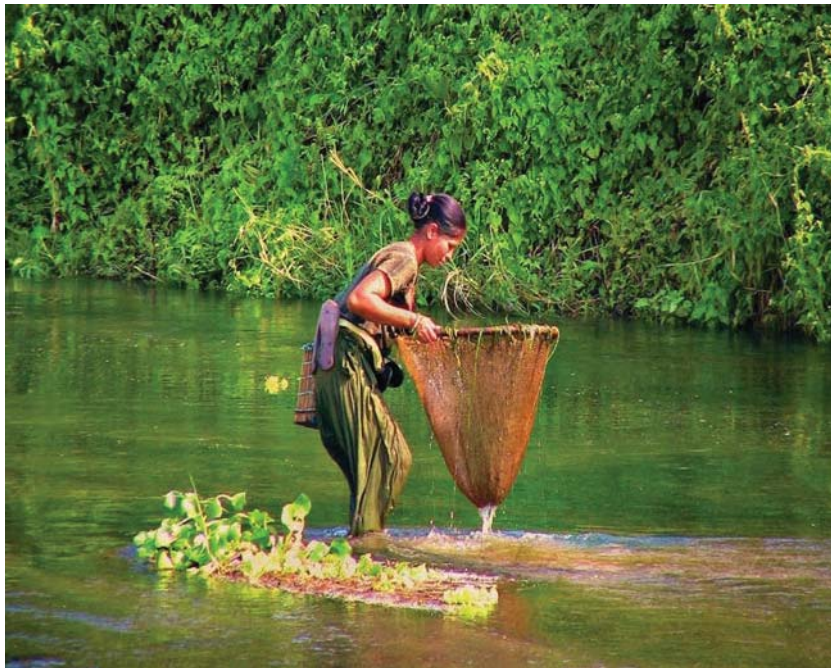
Imagen 4 Señora pescando utilizando el Matayawalh

La pesca era un oficio que muchos hombres y mujeres realizaban para obtener alimentos. Desde hace mucho tiempo atrás son las mujeres quienes mayormente se encargan de esta actividad. Donde un conjunto de señoras se organizaban para salir en grupo a pescar. Y en el agua hacían un círculo con un matayawalh para acorralar al pescado y que éste no tuviera cómo escapar. A esta técnica se le llama agulah. Este mismo procedimiento lo realizaban los hombres. En caso de que una persona se quedara sin pescados, se unían y cada uno le repartía uno o dos pescados, para que no se fuera a su casa sin nada que llevar a su familia.