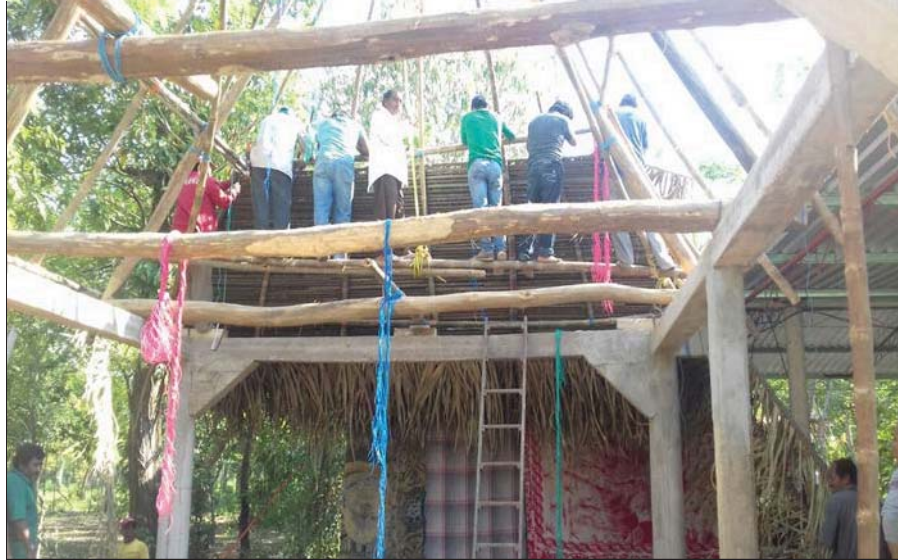
Imagen 2 Armazón del techado de palma

En esta imagen se observa a los señores construyendo el armazón que se ocupa para construir la casa de palma y empezando con el amarre de las palmas.