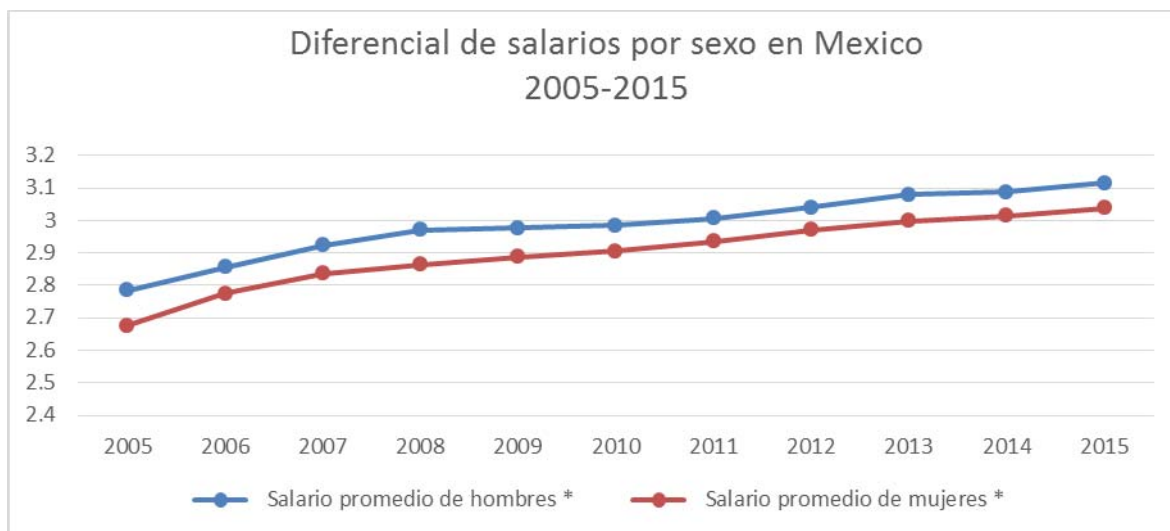
Grafico 4 1. Diferencial Salarial por sexo en México