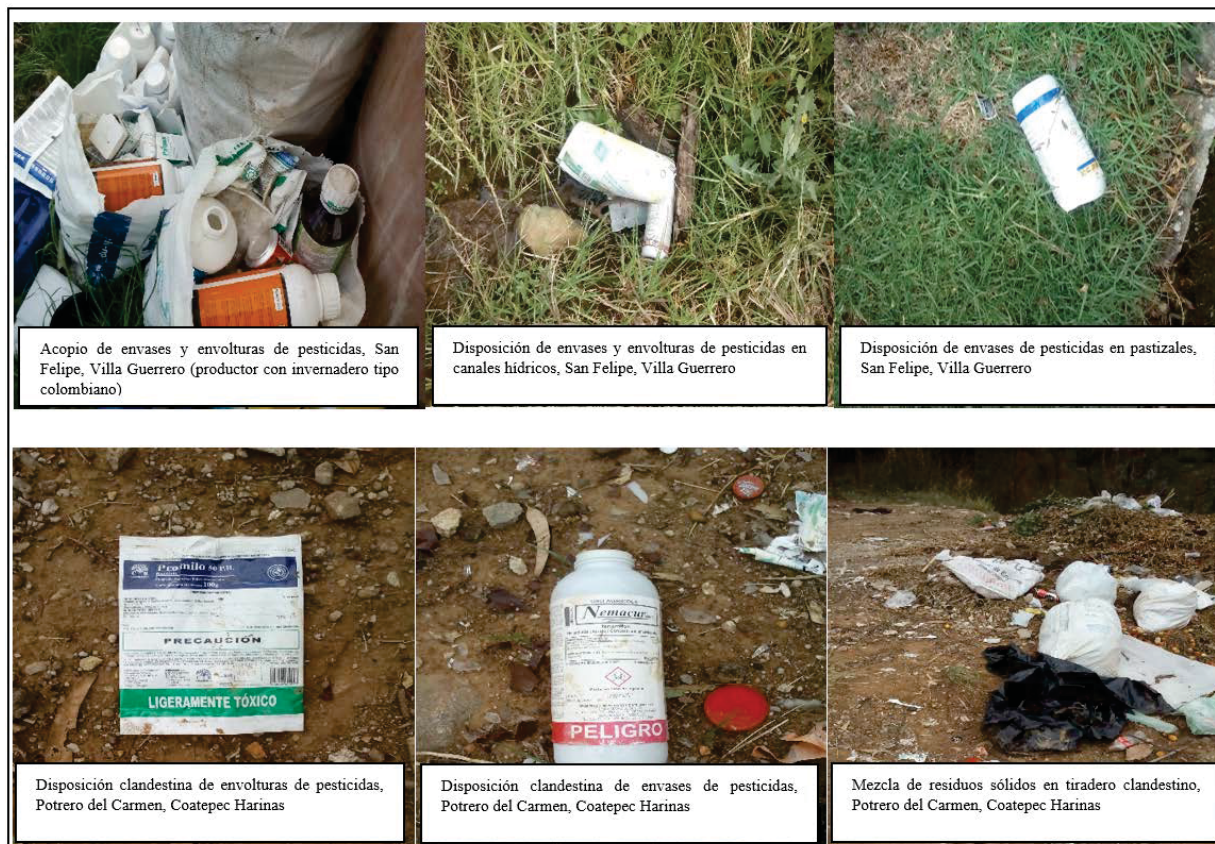
Figura 4. Disposición incontrolada de envases de pesticidas agrícolas

En los múltiples recorridos de campo realizados en la región, se pudo encontrar varios casos evidenciados en la Figura 4, donde los productores disponen sin control dichos residuos, ocultándolos entre los árboles, los matorrales, el pastizal, en las corrientes hídricas, en los tiraderos clandestinos o mezclado con los residuos sólidos domésticos, con las implicaciones negativas que ello provoca, siendo el más latente la contaminación de los afluentes hídricos.