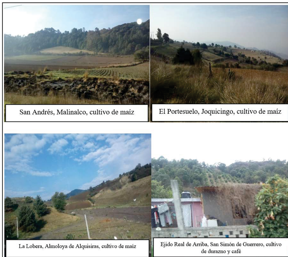
Figura 3. Extensión de las áreas de cultivo agrícola

regularmente es a baja escala, se han presentado varias externalidades que generan mayor presión ambiental, uno de los más latentes es la utilización de pesticidas industrializados altamente contaminantes, para acelerar el crecimiento y desarrollo de las plantas, cuyo precio 16% menor respecto a los insumos orgánicos, permite mejorar el margen de utilidad. El otro gran problema es la extensión de las áreas de cultivo hacia las zonas boscosas, tal como se aprecia en la Figura 3, que se busca aprovechar la humedad, la fertilidad de suelo y la protección solar que brindan los árboles y resto de la vegetación. Esta práctica ha implicado la deforestación, la reducción de la cubierta vegetal, el deterioro de la flora, así como el desplazamiento y extinción de la fauna, misma que altera significativamente el equilibrio ecológico-ambiental, lo que permite inferir que dichas prácticas no son sustentables productivamente, limitando a su vez la formación de sistemas productivos.